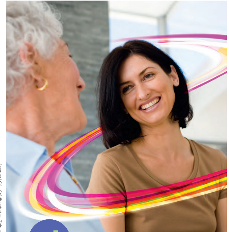
Agence LCA - Crédits photos: Thinkstock

TOUT SAVOIR SUR L'ERGOTHÉRAPIE ET LES ERGOTHÉRAPEUTES