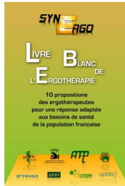
2008 Livre blanc de l'ergothérapie lors des 1ères Assises