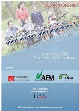
2007 Audition publique HAS