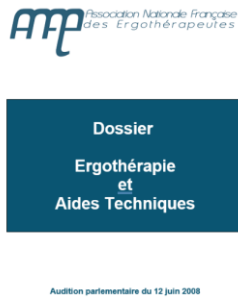
2008 Audition parlementaire