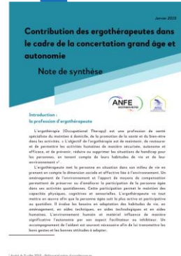
2019 Consultation Loi grand âge et autonomie