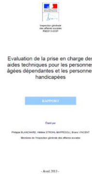
2013 Rapport IGAS