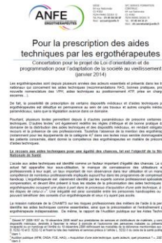
2014 Concertation loi ASV